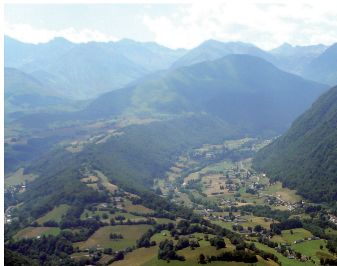
© Haut Val d'Adour, Alix années 1950 ; Haut Val d'Adour, Béringuier 2008